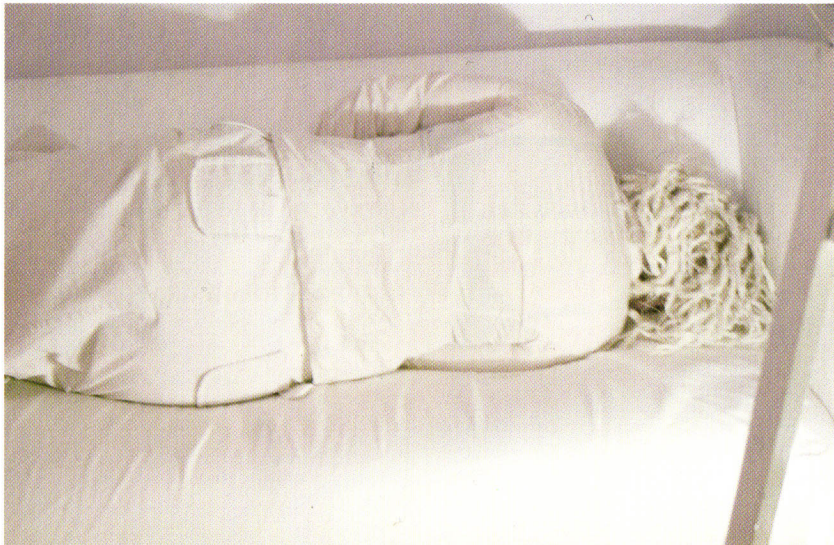
Die Frau in Weiß im Bildessay „absurdities“